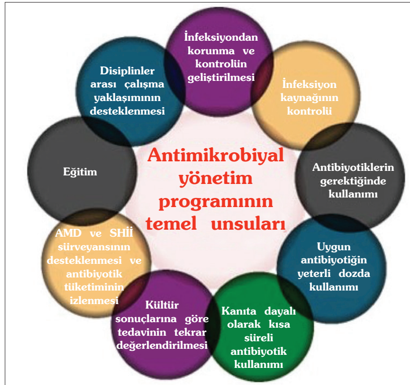
Şekil 2. Antimikrobiyal yönetim programının temel unsurları. AMD: Antimikrobiyal direnç, SHİİ: Sağlık hizmetleri ile ilişkili infeksiyonlar.

Amaca ulaşabilmek için birçok strateji mevcuttur ve kanıt düzeyi yüksek olan stratejiler; sürekli denetim ve geri bildirim, kısıtlama ve onay alınması, eğitim, de-eskalasyon, ardışık tedavi ve tedavi sürelerinin kısaltılmasıdır. Son yıllarda aminoglikozidlere ve vankomisine ek olarak karbapenem ve piperasilin-tazobaktam serum düzeylerinin izlenmesi de stratejiler arasına girmiştir. Antimikrobiyal yönetimi aslında bir süreç yönetimidir.