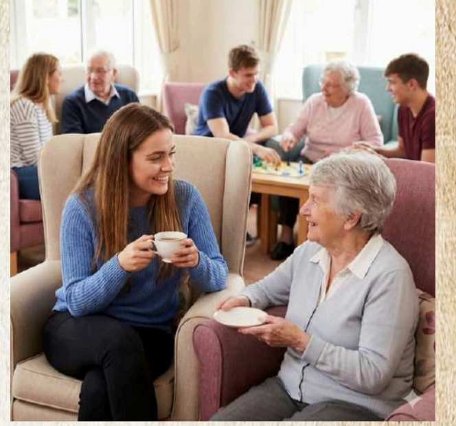
Yapay zeka tarafından oluşturulmuştur.

Ayrıca bu proje kapsamında kurumların oluşturduğu toplantılar ile bu kez yaşlılar gençleri dinleyecek. Gençler ne istiyor, yaşlılardan ne bekliyor, nasıl beraber güzel yaşanın cevabı gençlerden alınacak.