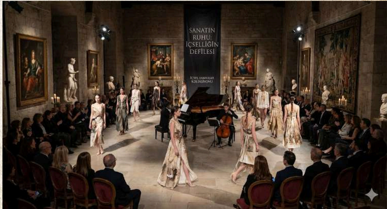
Yapay zeka tarafından oluşturulmuştur.

Sonuç olarak, “Disiplinler arası Buluşma Koleksiyonu” sadece bir defile veya sergi değil; sanat ve modanın buluştuğu, genç yaratıcıların kendi diliyle konuştuğu bir devrimdir. Her parça, ruhun ve yaratıcılığın kalbe dokunduğu, izleyiciyi düşündüren ve ilham veren bir eser olarak öne çıkıyor. Böylece ideal dünyada sanat ve moda, makinenin değil, insanın nefesinden doğan bir ifade biçimi olarak yeniden hayat buluyor.