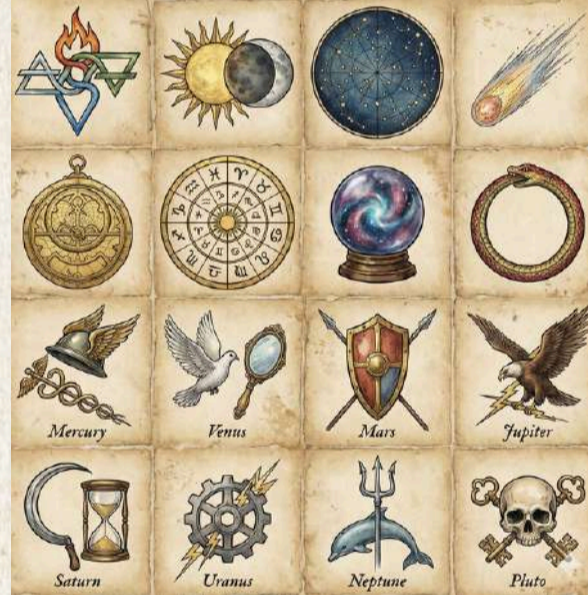
Yapay zeka tarafından oluşturulmuştur.

♊ İkizler: 2026'da sanki sosyal bir kelebek gibi uçuyorsun İkizler! İletişim yeteneğin zirvede, girdiğin her ortamda ortamı sen coşturuyorsun. Yeni projeler, yeni fikirler... Aklın dur durak bilmiyor. Kurduğun yeni dostluklar, sana hem eğlence hem de kariyerde fırsatlar getirecek. Bol bol telefon çalacak, bol bol mesajlaşacaksın. Hayatına yeni ve ilham verici insanlar akıyor, kapıları açık tut! Valizinde her zaman hazır bulunsun hiç beklemediğin anda beklemediğin yerlere gidebilirsin.