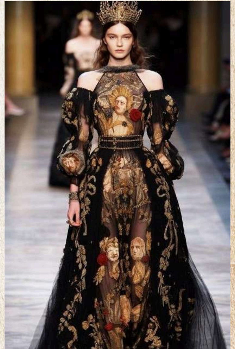
Yapay zeka tarafından oluşturulmuştur.

Evet, makineler kusursuz işler üretebilir. Ama sanat kusursuz olmak zorunda değildir. Hatta çoğu zaman kusurlu olduğu için gerçektir. İnsan eli değdiği için anlamlıdır. Moda da böyledir; sadece satılmak için değil, anlatmak için vardır. Belki de bugün ihtiyacımız olan şey şudur: Daha az hız, daha çok his. Daha az algoritma, daha çok insan. Çünkü makine tasarlayabilir ama giyinen, hisseden ve anlam yükleyen hâlâ insandır.