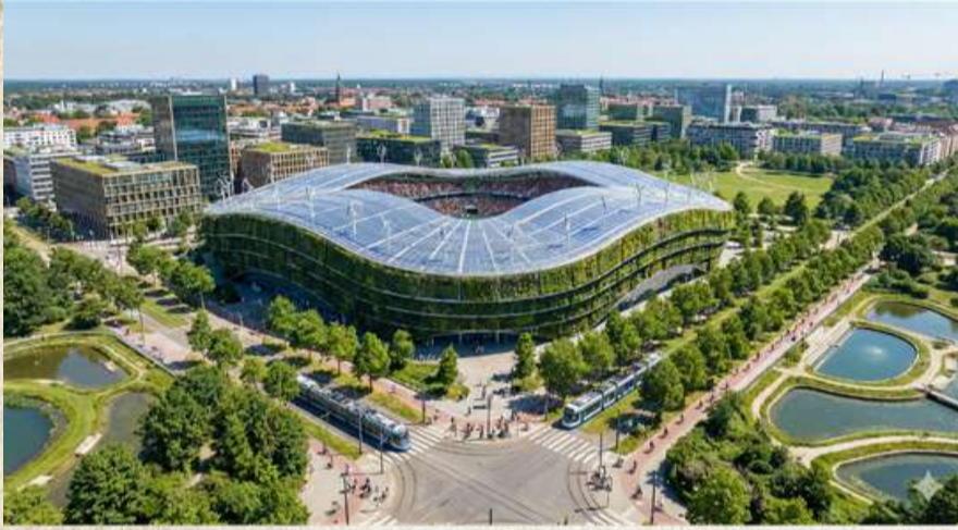
Yapay zeka tarafından oluşturulmuştur.

Karar, futbol kamuoyunda geniş yankı uyandırırken bazı büyük kulüplerden sert tepkiler geldi. Avrupa'nın en yüksek gelirli kulüplerinden oluşan bir grup, maaş ve bonservis tavanının "serbest piyasa dinamiklerine aykırı" olduğu gerekçesiyle FIFA'ya resmi itiraz başvurusunda bulundu. Kulüpler, bu düzenlemenin yıldız oyuncuların dolaşımını kısıtlayacağını ve küresel marka değerlerini zayıflatacağını savunuyor.