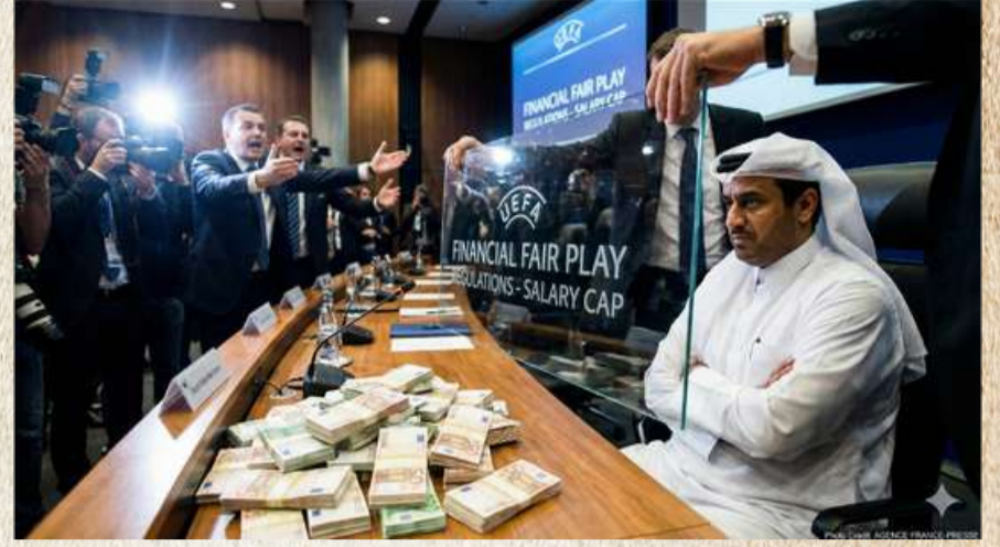
Yapay zeka tarafından oluşturulmuştur.

UEFA cephesi ise itirazlara net bir yanıt verdi. Yapılan açıklamada, "Bu sistem futbolu yoksullaştırmak için değil, herkes için erişilebilir ve sürdürülebilir kılmak için tasarlanmıştır. Rekabet artık bütçelerle değil, akılla kazanılacaktır" ifadeleri kullanıldı. Kurum ayrıca altyapıdan yetişen oyuncular için bonservis muafiyetleri ve çevresel yatırımlara yönelik teşvik mekanizmalarının devreye sokulacağını duyurdu.