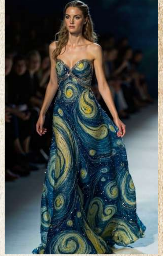
Yapay zeka tarafından oluşturulmuştur.

Her kıyafet, iki yaratıcı zihnin buluştuğu özgün bir ifade alanına dönüşüyor. Sanatçının kavramsal üretimi, modacının teknik becerisiyle somutlaşıyor; modacının tasarım gücü, sanatçının ruhuyla derinleşiyor. Böylece koleksiyon, yalnızca bir defile veya sergi değil, sanat ve modanın buluştuğu, gençlerin kendi diliyle konuştuğu bir devrim hâline geliyor.