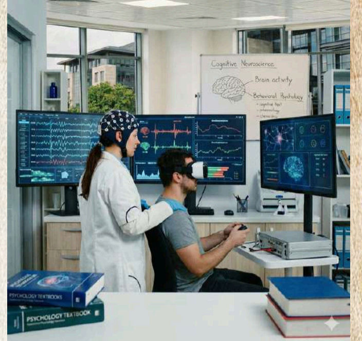
Yapay zeka tarafından oluşturulmuştur

Bu dünyada terapi anlayışı, bildiğimiz "uzan koltuğa ve çocukluğuna inelim" klişesinden çok uzakta. Bunun yerine, zihninizde yıllar içinde oluşan düşünce odacıklarını temizleyen, ferahlatan bir süreç var. İnsanlar düzenli olarak zihinlerini "bakıma" alıyorlar. Tıpkı bahçedeki yabancı otları temizler gibi; insanı yoran, enerjisini tüketen takıntılı düşünceler tespit ediliyor. Kimi düşünceler budanıyor, kimisi şefkatle sulanıyor, kimisi ise yepyeni umutlarla aşılıyor.