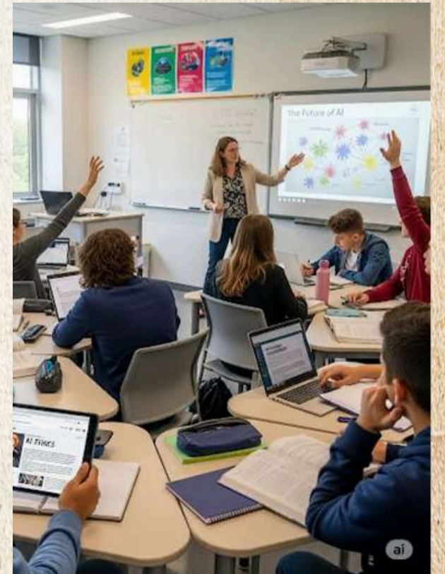
Yapay zeka tarafından oluşturulmuştur.

Mevcut uygulamalar, öğrenmeyi yalnızca ders saatleriyle sınırlamayan, destek mekanizmalarıyla güçlendirilmiş daha adil bir eğitim ortamının mümkün olduğunu ortaya koyuyor.