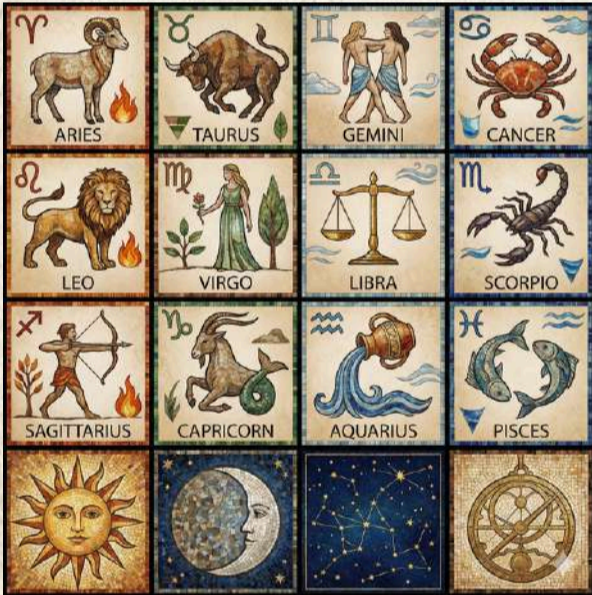
Yapay zeka tarafından oluşturulmuştur.

♐ Oğlak: Yükseliş zamanı Oğlak! 2026, "başarının dorukları" temalı. Yıllardır attığın sağlam adımlar, bu yıl sana itibar, terfi ve yetki olarak geri dönüyor. Kariyerinde o güçlü pozisyona ulaşıyorsun. Bu yıl, aile ve iş dengesini mükemmel kuracaksın. İnsanlar artık sana rol model olarak bakacak. Gurur duy kendini, bu başarı senin! Ayrıca yeni hobilerde seni bekliyor her konuda başarılı olduğun gibi yine zirveye ulaşacaksın.