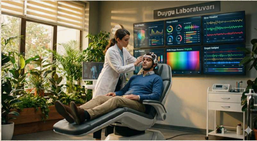
Yapay zeka tarafından oluşturulmuştur.

Burada bilim, sadece dış dünyayı anlamak için değil, insanın kendini iyileştirmesi için var. Canınız mı sıkın? Eczaneye koşup ilaç almak yerine "Duygu Laboratuvarları"na gidiyorsunuz. Biriyle kavganız mı var? Öyle bağırp çağırarak yok. Teknoloji sayesinde 10 dakikalığına karşınızdaki kişinin yerine geçebildiğiniz, dünyayı onun gözünden görebildiğiniz simülasyonlar var. Karşınızdakinin korkularını, hassasiyetlerini o kadar derinden hissediyorsunuz ki, kavga etmek anlamsızlaşıyor; yerini anlamaya bırakıyor.