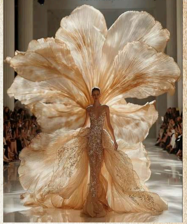
Yapay zeka tarafından oluşturulmuştur.

Bu koleksiyon, yalnızca bir defile değil, aynı zamanda bir sanat sergisi niteliği taşıyor. Moda ve sanat arasındaki sınırlar tamamen kalkmış; genç yaratıcılar, modayı bir giyim kategorisinin ötesinde, tıpkı sanat gibi anlam üreten, duygu taşıyan ve hikâyeye anlatan bir ifade biçimi olarak kullanıyor. Her kıyafet, artık sadece bir giysi değil, bir sanat nesnesi hâline geliyor. Her parçanın iki farklı imzası var: Bir yanda sanatçının düşünsel ve duygusal tasarımı; diğer yanda modacının teknik ustalığı ve form yaratma becerisi.