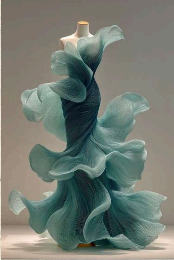
Yapay zeka tarafından oluşturulmuştur.

Ortaya çıkan ürün, hem bir resim kadar duygu taşıırken hem de beden üzerinde hayat bulan bir tasarım kadar işlevsel kalıyor. Genç tasarımcılar, “kumaş bir yüzey değil, sanatçının zihninin dolaştığı bir alan” diyorlar.