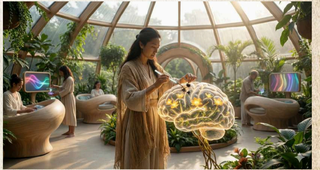
Yapay zeka tarafından oluşturulmuştur.

Eskiden "kendini gerçekleştirmek" diye soyut bir kavramdan bahsederdik hani... Bu dünyada bu, somut bir rutin. İnsanlar yılda bir kez kendi içlerine döndükleri derinleşme seanslarına giriyor. Kimisi geçmişin öfkesini dönüştürüyor, kimisi kalabalıklar içinde unuttuğu hayallerini tozlu raflardan indirip parlatıyor.