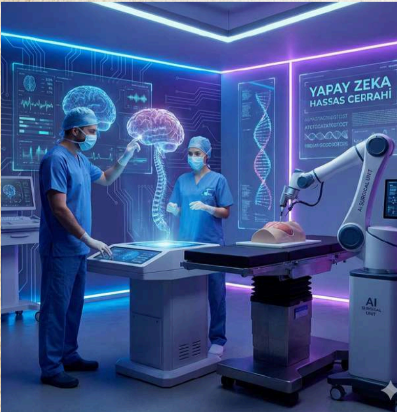
Yapay zeka tarafından oluşturulmuştur.

Hastanelerimiz bir düzen içerisinde. Acil servislerdeki yoğunluğu yöneten akıllı sistemler sayesinde, gerçekten ihtiyacı olana anında müdahale ediliyor. Robotik cerrahlar, akıllı laboratuvarlar sessizce işini yaparken, doktorlar hastanın dosyasını açtığı anda sadece eski testleri değil, gelecekteki riskleri de görüp ona göre karar veriyor. Ama tüm bu teknolojik dönüşümün en kıymetli yanı, insanı geri plana atmaması oldu. Aksine, makineleşmek yerine doktorlara ve hemşirelere nefes aldırarak hastayla temas edecek daha fazla alan açtı. Bir hemşirenin hastasına ayıracağı fazladan bir dakika, doktorun yüz yüze kurduğu o samimi iletişim... Sağlığın özü tam olarak da bu. Yapay zekâ ve insan elinin aynı masada buluştuğu dünyamızda sağlık, artık bir ayrıcalık değil; herkes için kapsayıcı ve umut veren bir yaşam standardı.