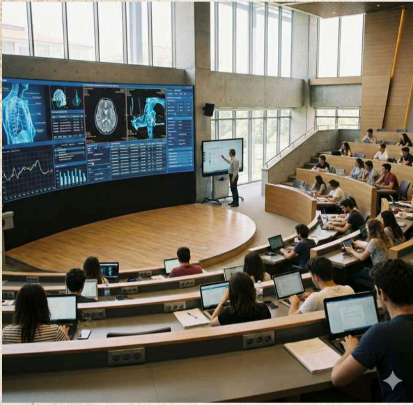
Yapay zeka tarafından oluşturulmuştur.

Hata yapmaktan korkulan o eski düzen, yerini "deneyerek öğrenme" kültürüne bırakmış.