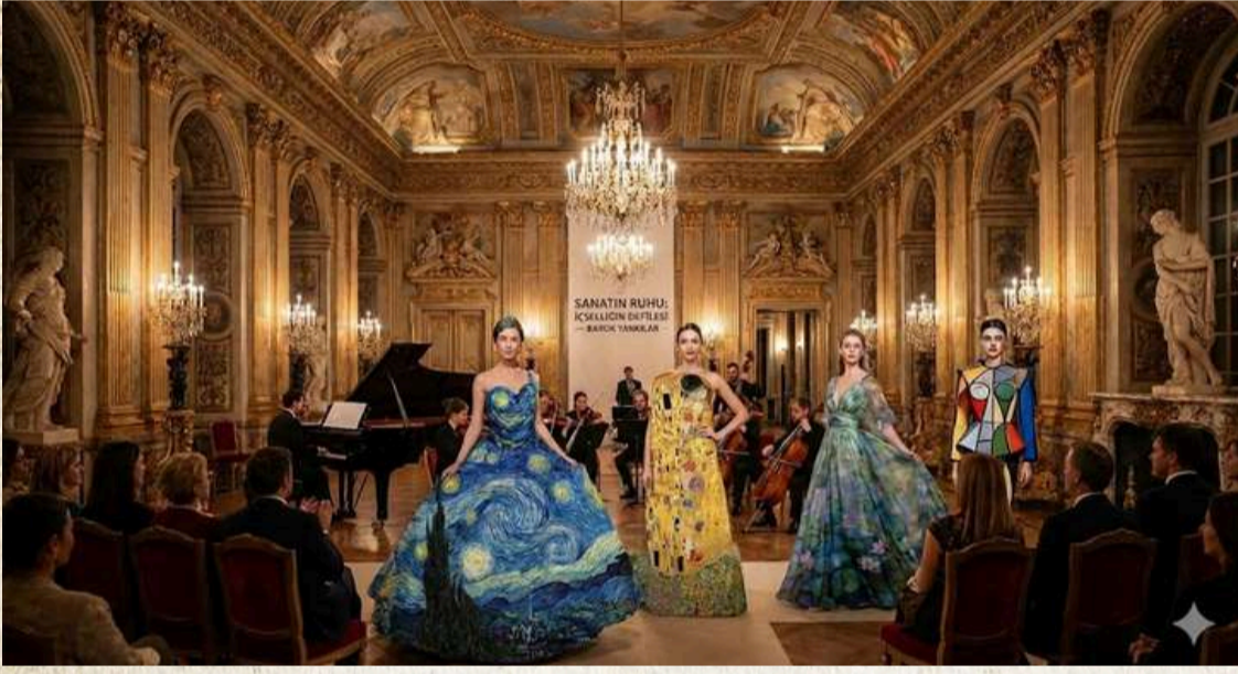
Yapay zeka tarafından oluşturulmuştur.

İdeal dünyada sanat ve moda, piyasanın değil, insan ruhunun alanıdır. Ticarileşmiş eserler veya algoritmik üretimler, duygunun ve özgünlüğün yerini alamaz. Koleksiyon, insan eli ve duygusu ile yaratılan sanatın gücünü gösteriyor; kusurlu ama gerçek, işlevsel ama içten, görünür ama taşınabilir bir sanat anlayışı sunuyor. Sonuç olarak, “Disiplinler arası Buluşma Koleksiyonu” her parçasıyla ruhun ve yaratıcılığın kalbe dokunduğu, izleyiciyi düşündürdüren ve ilham veren bir deneyim sunuyor. Böylece ideal dünyada sanat ve moda, makinenin değil, insanın nefesinden doğan bir ifade biçimi olarak yeniden hayat buluyor.