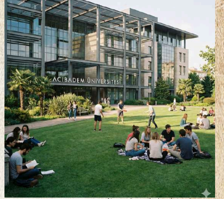
Yapay zeka tarafından oluşturulmuştur.

Sınıflara girdiğinizde hoca ve öğrenci arasındaki o görünmez hiyerarşik duvarın yıkıldığını görüyorsunuz; artık masanın iki tarafı yok, yan yana oturup üreten, tartışan bir "beyin takımı" var. "Bu konu benim gerçek hayatta ne işime yarayacak?" sorusu da çoktan rafa kalkmış çünkü sabah teorisi konuşulan bir konu, öğleden sonra hemen atölyelerde, laboratuvarlarda ya da sahada pratiğe dökülüyor.